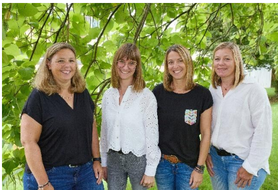
Gruppe 3 – „Bärle-Gruppa“