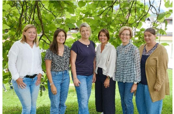
Gruppe 2 – „Füchsle-Gruppa“