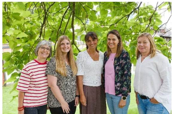
Gruppe 4 – „Fröschle-Gruppa“