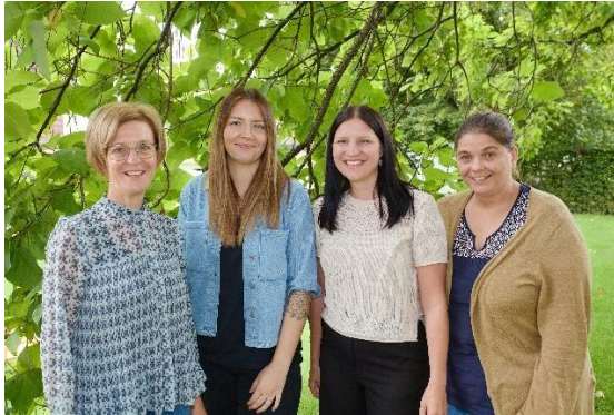
Gruppe 1 – „Häsle-Gruppa“